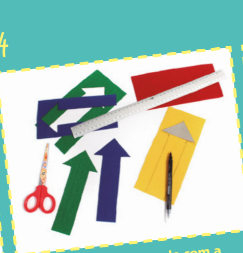
Feu servir aquest triangle com a plantilla per a fer les puntes de les fletxes. Retalleu-ne quatre de feltre, una de cada color.