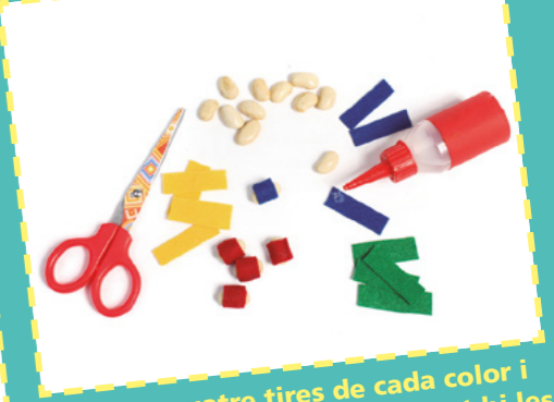
Retalleu quatre tires de cada color i folreu les mongetes enganxant-hi les tires amb la silicona. Una altra opció és pintar les mongetes de colors.