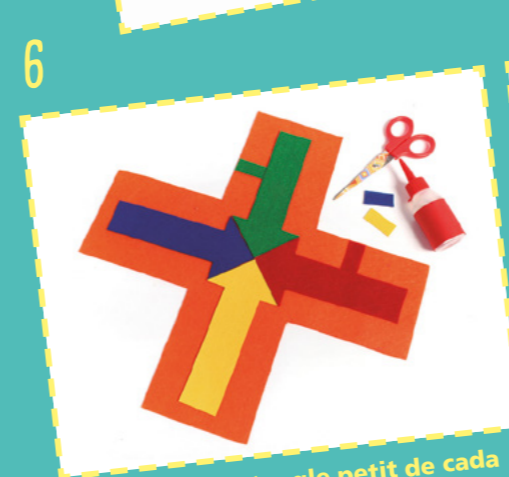
Retalleu un rectangle petit de cada color i enganxeu-lo al costat de cada fletxa.