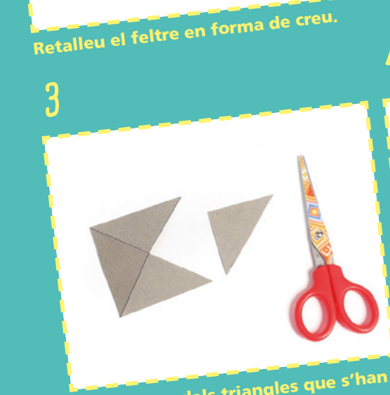
Retalleu un dels triangles que s'han format dins el quadrat.