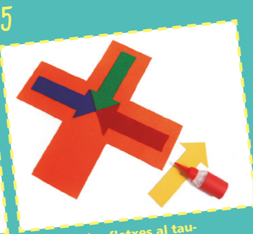
Enganxeu les fletxes al taulell fent coincidir les puntes de les fletxes.