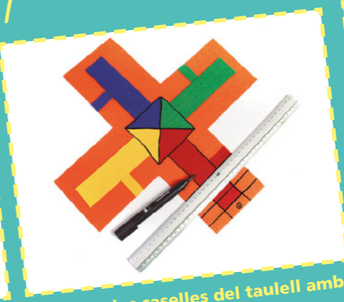
Marqueu les caselles del taulell amb el retolador gruixut.